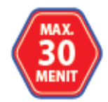
IMBAUAN 30 MENIT