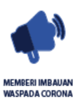
MEMBERI IMBAUAN WASPADA CORONA