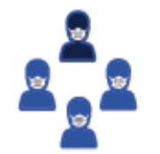
BRIEFING TIM KEBERSIHAN SAAT PERGANTIAN SHIFT