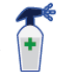
MENYEDIAKAN HAND SANITIZER